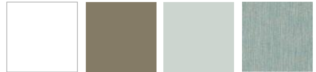
BLANCO LISO TORTORA WAX GRIS PERLA LISO ALUMINIO TRIANA