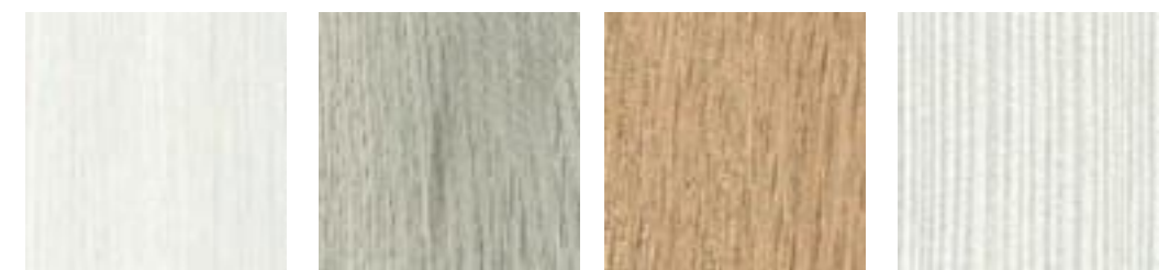
ROBLE ÁRTICO ÉTNICO ROBLE TORTUGA ÉTNICO ROBLE DALTON ÉTNICO PINO BLANCO GREY