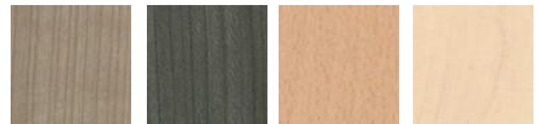
CEREZO GRIS OLMO OP HAYA BALCAN SEDA ABEDUL FATO SOFT